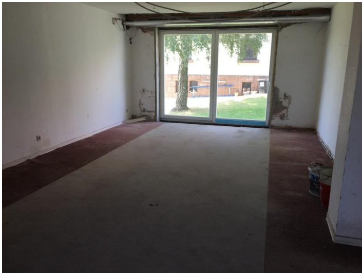
Erdgeschoss Richtung Westen