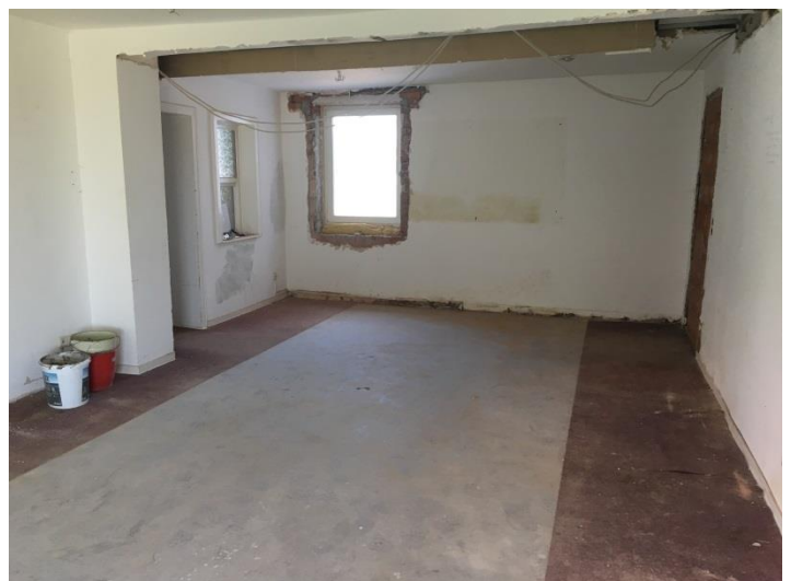
Erdgeschoss Richtung Osten