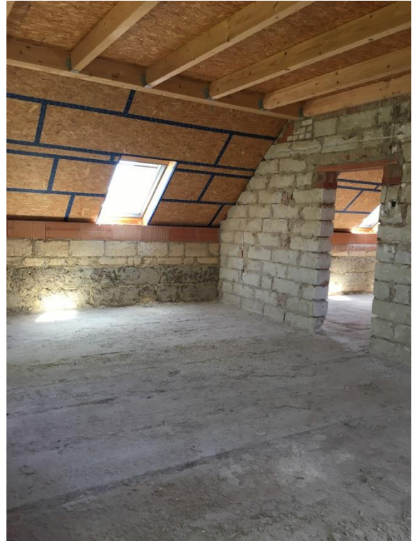
Dachgeschoss Richtung Nord-Ost