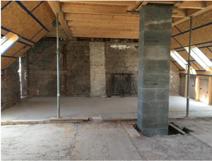
Dachgeschoss Richtung Süden